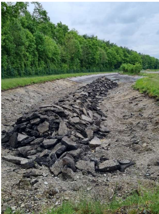
Randbefestigung zur verkürzten Teichanlage - Juni 2025, mit Asphaltierung der beiden Dammböschungen.

Im Mai 2025 wurde von den inzwischen gekürzten Teilen der zwei Klärbecken der Asphalt herausgenommen. Es folgte der Rückbau der abgetrennten Klärbecken; das Asphalt-Material wurde für die Querdämme zum Abdichten wiederum verbaut.