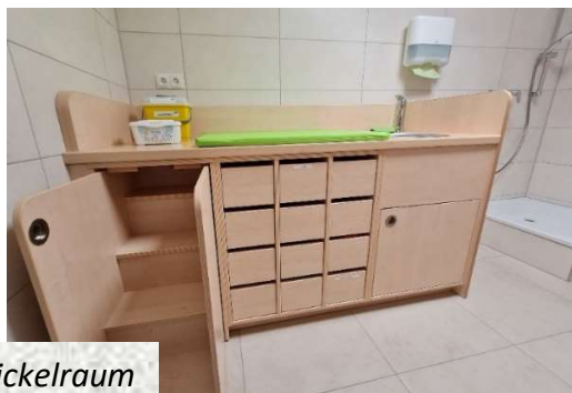
der neue Wickelraum

Die alten WCs wurden rausgenommen, die Bodenfliesen erneuert und die WC-Trennwände getauscht. Auch im Obergeschoß wurden die Decken abgehängt, die Heizkörper erneuert und neue Türen gesetzt.